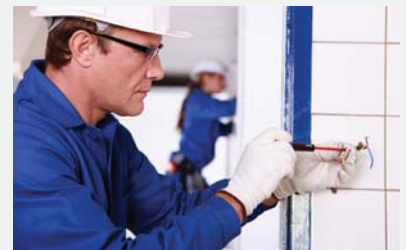
voor de installateur