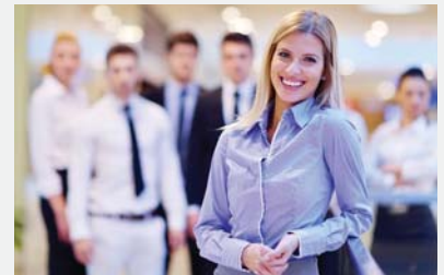
Managers in het MKB